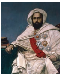
Emir ABD EL-KADER